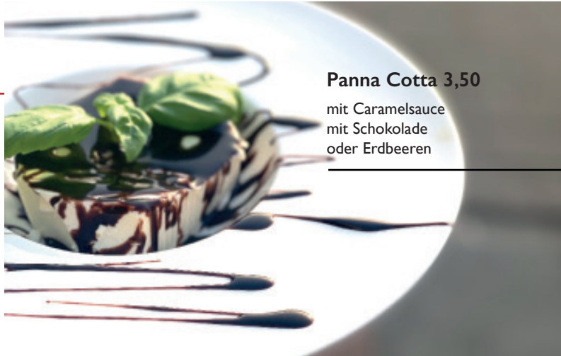
Panna Cotta 3,50

mit Caramelsauce mit Schokolade oder Erdbeeren